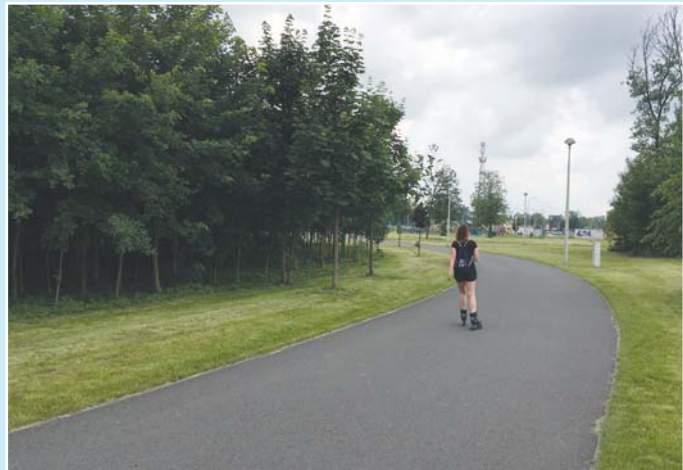
Odbor věnuje pozornost i lokalitě poblíž boxových garáží v ulici U Cementárny, která plynule přechází do areálu In-line Parku. Za garážemi se návštěvníkovi této části Vítkovic otevírá svět zeleně a inline drah, na který plynule navazuje rozsáhlé sportoviště.