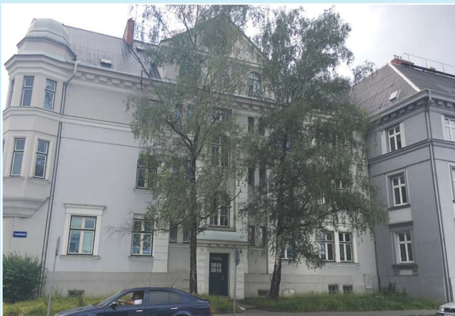
Letos by měl být dokončen projekt rekonstrukce domu v ulici Tavičské 34.

Rovněž v majetkové agendě se potýkáme s dlužníky, přestože ceny za pronájem pozemků určené k relaxaci a odpočinku (původní zahrádky) jsou dlouhodobě na velice nízké úrovni. Intenzivně pracujeme na dokumentu, který se chystáme v nejbližší době představit vedení městského obvodu Vítkovice, jež bude obsahovat znalecké posouzení určitých typů pozemků s ohledem na jejich cenu v místě a čase obvyklou a způsob užívání. V posledních letech jsme uplatňovali nárůst cen pouze o koeficient inflace