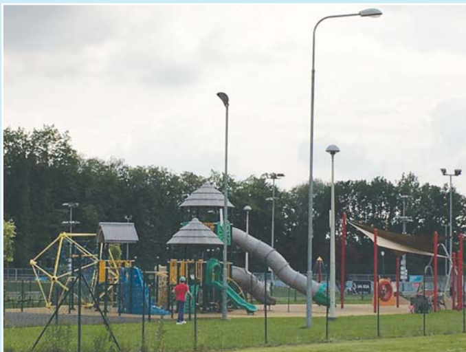
In-line Park je jen kousek od garáží v ulici U Cementárny.

S pečlivostí se věnujeme boji s dluhy našich nájemců a ukazuje se, že pevná pravidla, která současné vedení městského obvodu zakotvilo, jsou osvědčeným nástrojem v tomto klání.