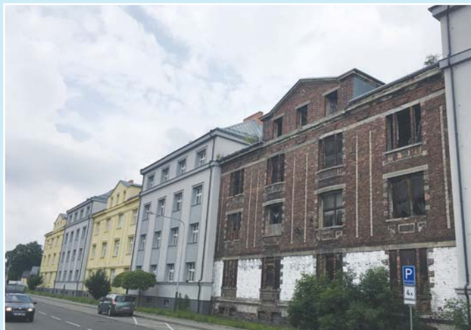
Na adrese Štramberská 10 vznikne po rekonstrukci objektu 11 moderních bytů.